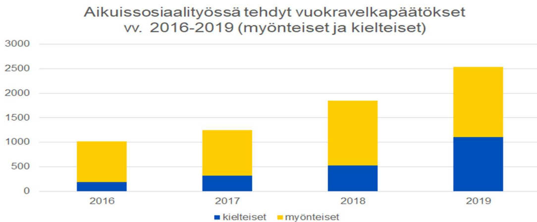
Kuva 4. Aikuissosiaalityössä tehtyt toimeentulotuen vuokravelkapäätökset (myönteiset/kielteiset).

Aikuisten sosiaalipalveluissa vireille tulleiden vuokravelkahakemusten määrä on kasvanut voimakkaasti muutaman viime vuoden aikana.