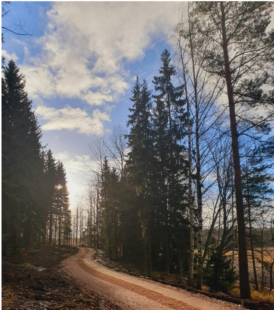
Kuva 1 Uutta rinnakkaisreittiä Riimukallion alueella. Reitien toteutuksessa on huomioitu, että puuston aukkokohdassa puiden välinen etäisyys on enimmillään reunapuiden korkeuden verran.

Rinnakkaisreittien rakentamisen tarpeellisuus kyseenalaistettiin etenkin Keskuspuiston ja Pitkäjärven rannalla kulkevien yhteyksien osalta. Rakentamishjelmassa kuvatut rinnakkaisreitit tullaan säilyttämään ennallaan, sillä niitä on perustellusti esitetty alueille, jossa latureittien kysyntä ja käyttöaste on suurta tai yhteyksiväleille, jotka ovat avainasemassa hiihtoreittien jatkuvuuden ja saavutettavuuden näkökulmasta. Rinnakkaisreittien ansiosta ulkoilureitit pystyvät palvelemaan laajempaa käyttäjäryhmää ympärivuotisesti. Uusien rinnakkaisreittien toteutuksessa tullaan huomioimaan maisemointi ja puiden välisten aukkojen etäisyys, jotta maisema ja eläinten kulkureitit pysyisivät mahdollisimman eheinä.