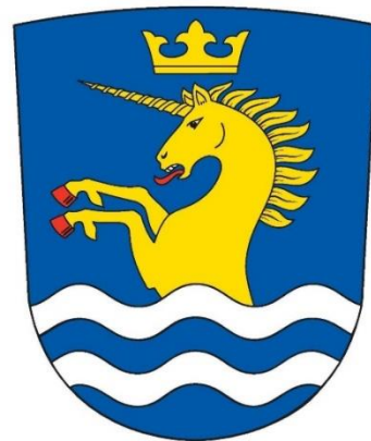
KAUKLAHTI - KÖKLAX

Valmisteluryhmä on käyttänyt alueella etätapahtumista ja itse asukasfoorimitoiminnasta tiedottamiseen vuoden aikana 400,00 euroa. Toimintaan vaikuttivat maaliskuusta alkaen epidemiarajoitukset.