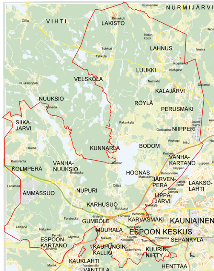
Suunnittelualueen likimääräinen sijainti Espoon opaskarttopohjalla