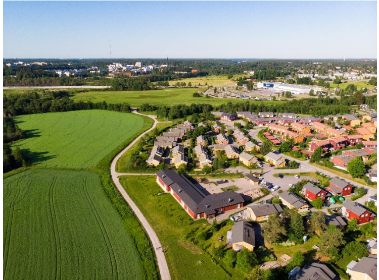
Fallåker/Bemböle ilmasta kesällä 2020

Arviointikertomuksen lisäksi tarkastuslautakunta antaa valtuustolle lausunnot toisesta ja kolmannesta osavuosisikatsauksesta sekä konserniraporteista.