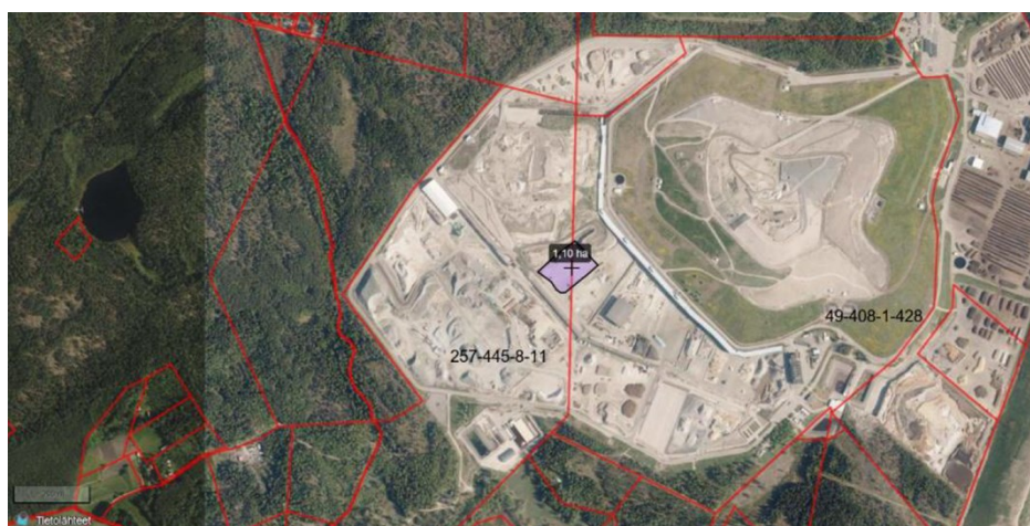
Kuva 2. Alueen sijainti Ämmässuon alueella.