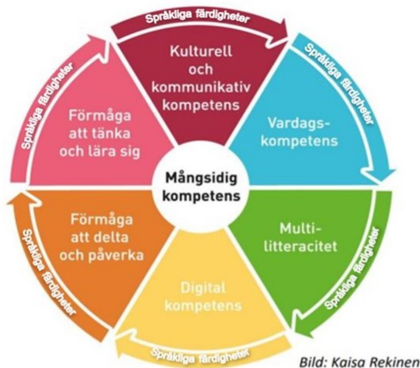
Bild 2 Mångsidig kompetens i småbarnspedagogiken på svenska i Esbo

Grunden för mångsidig kompetens hos barnen läggs i tidig ålder. Mångsidig kompetens utvecklas hos barnet i småbarnspedagogiken och fortsätter systematiskt genom förskoleundervisningen och den grundläggande utbildningen vidare i livet. Förutsättningarna för att utveckla mångsidig kompetens stärks i takt med att barnen utvecklas. Mångsidig kompetens inom småbarnspedagogiken är beskrivet utifrån sex delområden som har beröringspunkter med varandra. I den svenskspråkiga småbarnspedagogiken i Esbo lyfts särskilt fram att utveckling av barnets språkliga färdigheter anknyter till alla områden inom mångsidig kompetens.