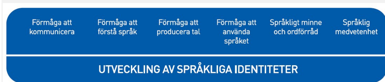
Figur 2. Språkutvecklingens centrala delområden inom småbarnspedagogiken

Med tanke på språkinläringen är det viktigt att vara medveten om att barn i samma ålder kan befinna sig i olika skeden av språkutvecklingen inom olika delområden. De språkliga identiteterna utvecklas när barnen får stöd och handledning inom de centrala delområdena för språkliga kunskaper och färdigheter.