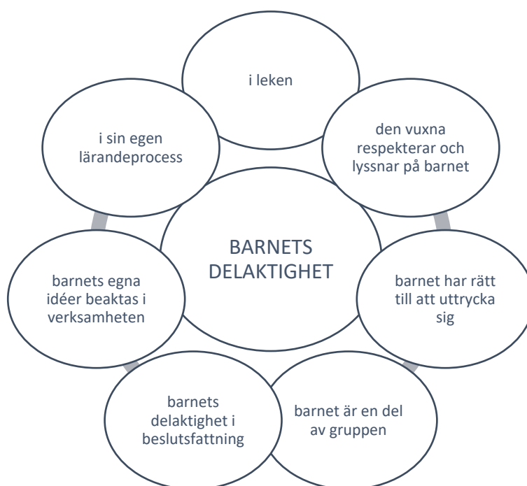
Bild 3 Delaktighet i småbarnspedagogiken

Barnens tidigare erfarenheter, intressen och idéer är utgångspunkten då verksamheten planeras. Personalens ansvar är att beakta att alla barn är delaktiga och har möjlighet att påverka frågor som gäller dem och verksamheten. Inom givna ramar ges barnet möjlighet att göra egna val och uppleva vad det innebär att vara delaktig i gemensamt beslutsfattande. Genom att främja delaktighet i verksamheten övar barnet sig på att lyssna och samarbeta med andra, kompromissa och ta hänsyn till andra. Att upptäcka att den egna åsikten är viktig är centralt för barnets känsla av delaktighet. Att barnet har en känsla av delaktighet innebär också att barnet blir bekräftat och känner sig inkluderad i gemenskapen.