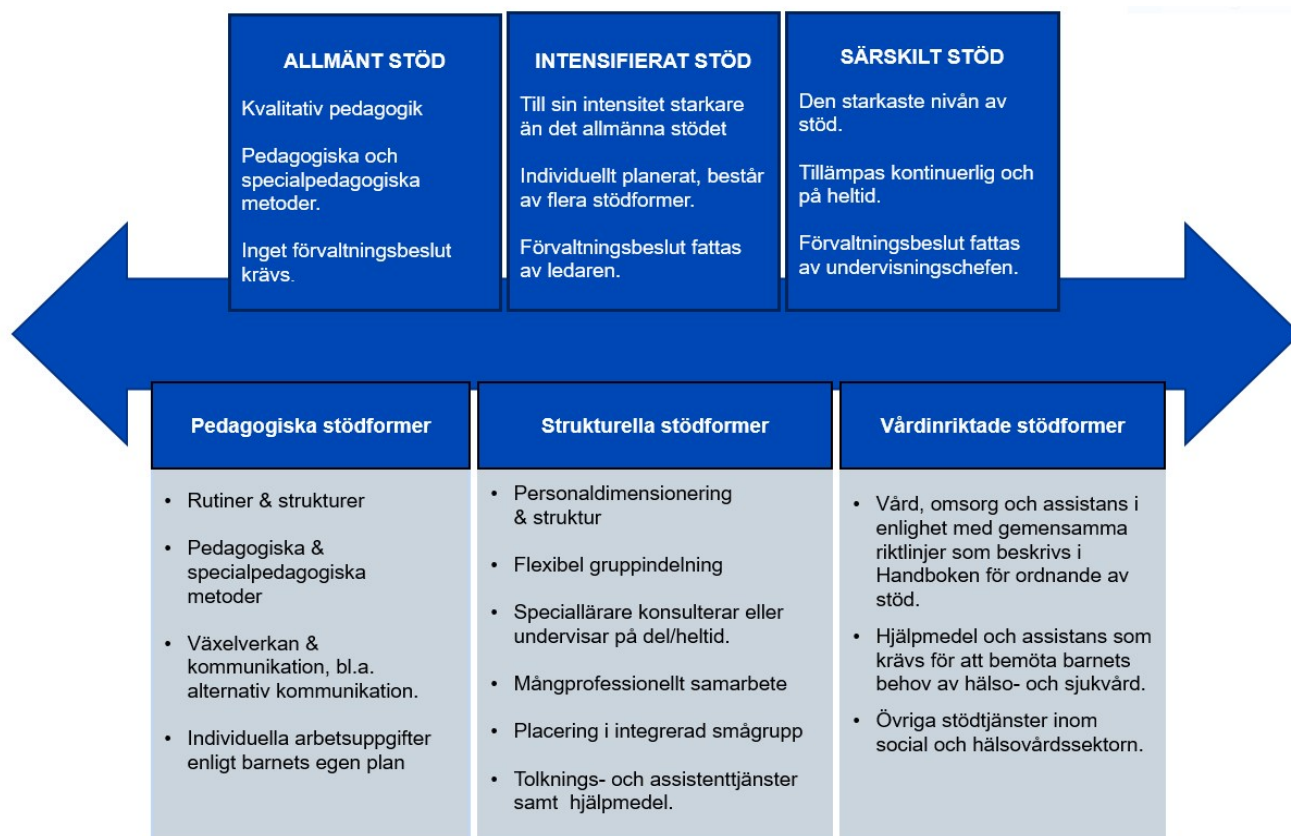
Figur 3. Översikt över stödnivåer och stödformer inom småbarnspedagogiken

ska ges utan onödigt dröjsmål. Allt stöd ordnas i enlighet med inkluderande principer så att barnet kan vara delaktigt och aktivt delta i den gemensamma verksamheten utgående från sina förutsättningar. Stödnivåerna och stödformerna sammanfattas i Figur 3