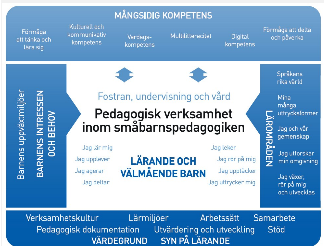
Figur 1. Referensram för den pedagogiska verksamheten

Den pedagogiska verksamheten inom småbarnspedagogiken ska präglas av ett helhetsskapande angreppssätt. Målet är att främja barnens lärande och välbefinnande samt mångsidiga kompetens (figur 1). Den pedagogiska verksamheten förverkligas i samverkan mellan barnen och personalen och i den gemensamma verksamheten. Barnens spontana verksamhet, personalens och barnens gemensamma idéer till verksamhet och verksamhet som planerats av personalen ska komplettera varandra. Den pedagogiska verksamheten inom småbarnspedagogiken ska genomsyra den helhet som består av fostran, undervisning och vård.