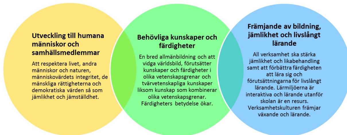
Bild 3 Sammanfattning av de nationella målen för undervisning och fostran

Utgående från målen i statsrådets förordning ska undervisningen ses som en helhet som ska utveckla sådan allmänbildning som behövs i den tid vi lever nu och som skapar grund för livslångt lärande. Utöver kompetens inom olika vetenskapsgrenar ska man sträva till en ämnesöverskridande kompetens.