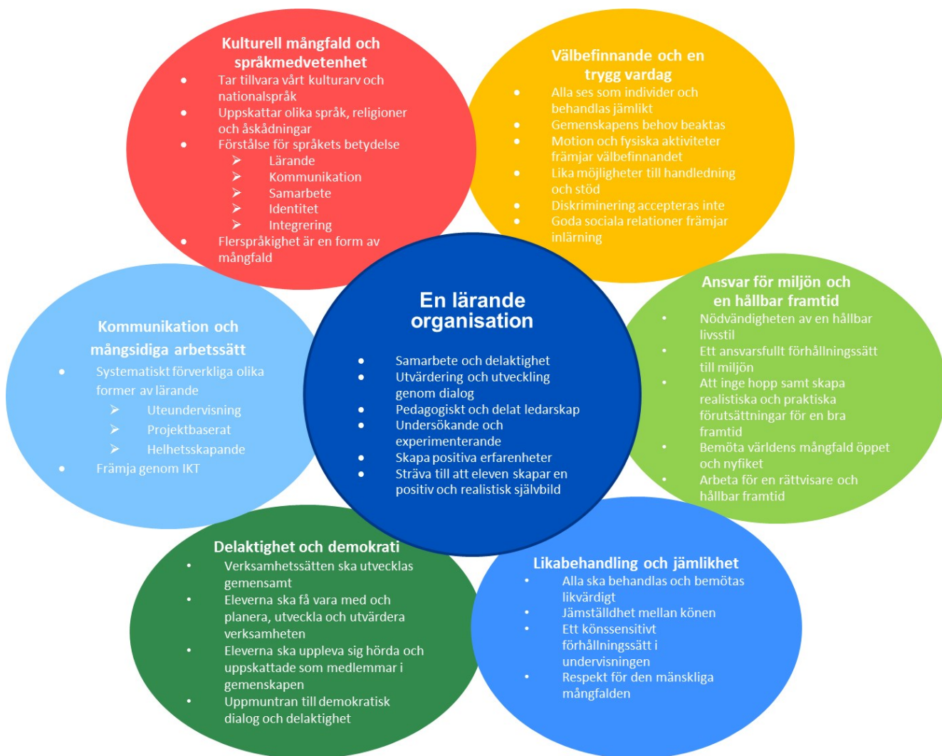
Bild 5 Sammanfattning av principerna för utvecklandet av verksamhetskulturen i grunderna för grundläggande utbildningens läroplan 2014

Utgångspunkten är en skola för alla elever. Eleverna erbjuds, i förhållande till sina förutsättningar, lämpliga utmaningar samt behövligt stöd för sitt lärande och sin utveckling. Verksamhetskulturen utvecklas så att varje barn har möjlighet att agera, utvecklas och lära sig som en unik individ och som medlem i gemenskapen. Alla som arbetar i skolan bär ansvar för elevens lärande och skolgång samt hans välmående i skolgemenskapen. Varje elev har rätt att må bra i sin skola.