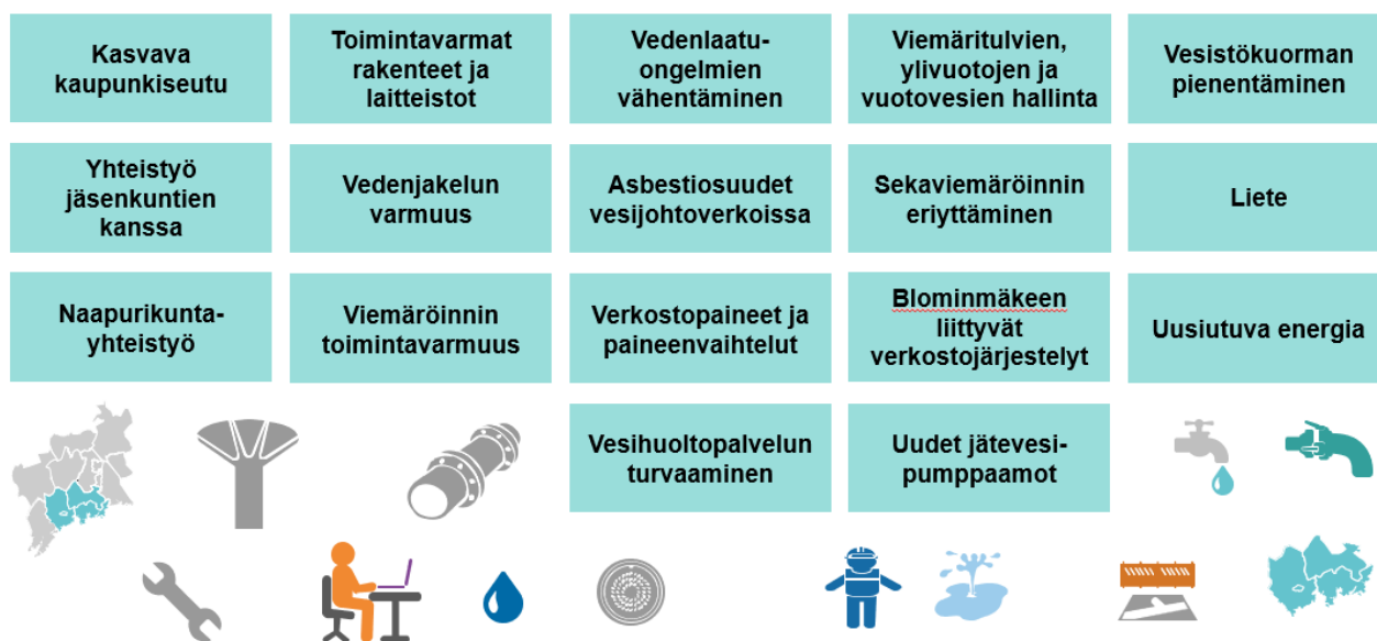
Kuva 3. Vesihuollon investointiohjelman 2023-2032 teemat.