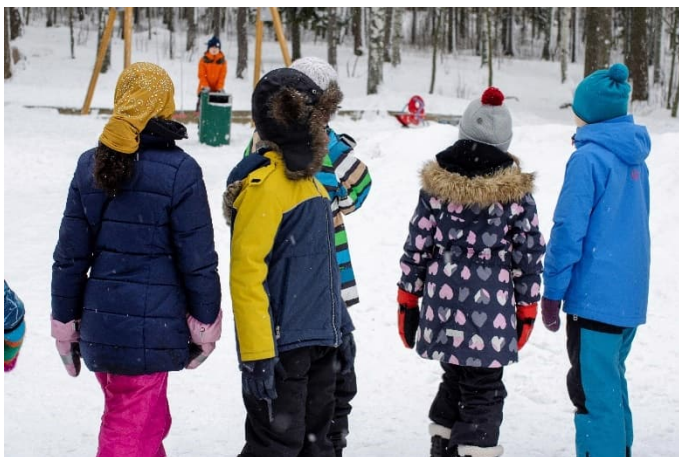
Kilon koulun oppilaita

Suomenkielisessä perusopetuksessa on rehtoreiden kanssa tehty koronasta palautumissuunnitelma, joka ohjaa kouluja yhteisöllisyyden vahvistamiseen rakentamalla hyvinvointia ja turvallista arkea.