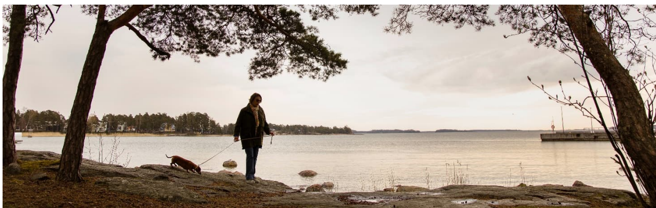
Rantaraitin ympäristöä Matinkylässä

Kaikkien toimialojen tulee määrätietoisesti jatkaa Taloudellisesti kestävä Espoo -tuottavuus- ja sopeutusohjelman toteuttamista, jotta kaupungin talous saadaan kestävään tasapainoon asukkaiden peruspalvelut turvaten.