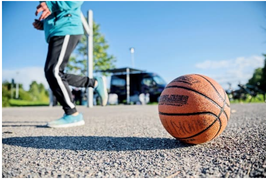
Nuorisopalveluja Juvanpuiston koulun kentällä

Nuorten kohtaamisten määrä oli syyskuun loppuun mennessä 103 557, joka on 37,5 prosenttia vuoden takaista enemmän. Koulujen kesäloma-ajan toimintaan on osallistunut 590 nuorta. Alueellisen nuorisotyön luku 83 912 kasvoi 65 prosenttia edellisvuodesta. Nuorisotilojen ja liikuvan nuorisotyön toiminnoissa tavoitetaan nuoria aktiivisesti. Nuorisopalveluissa on kehitetty kohdennettua pienryhmätoimintaa, jonka tarkoituksena on tavoittaa 9–17-vuotiaita, jotka tarvitsevat tukea esimerkiksi säännöllisessä harrastamisessa, hyvinvoinnin ja sosiaalisten taitojen vahvistamisessa tai muussa yksilöllisessä tarpeessa.