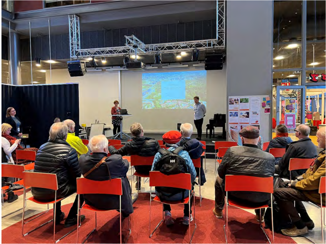
Kuva 1. Asiantuntijahaastattelu käynnissä Sellon kirjaston asukastilaisuudessa.