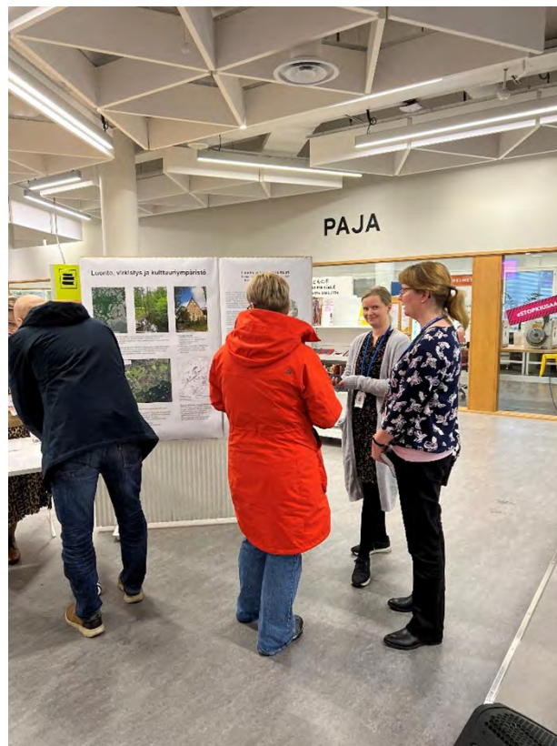
Kuva 2. Keskustelua luontoteeman pisteellä Ison Omenan kirjaston asukastilaisuudessa.