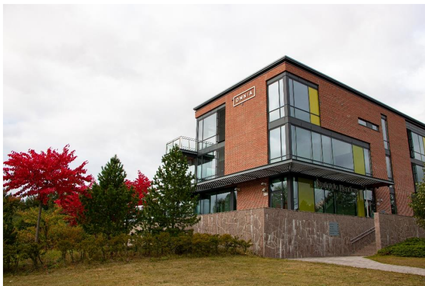
Omnia, Espoon keskuksen toimipiste

Ammatilliseen koulutukseen kohdentuneiden valtion rahoitusleikkausten vuoksi keväällä 2024 käytyjen tuotannollis-taloudellisten yhteistoimintaneuvottelujen tuloksena sopeutettiin yhteensä 6,2 milj. euroa, josta henkilöstömenoihin kohdistui 4,2 milj. euroa ja muihin toimenpiteisiin 2 milj. euroa. Irtisanomistarve oli 59 henkilöä, joista osalle voitiin tarjota muita määräaikaista tehtäviä. Tilatehokkuutta lisättiin luopumalla vuokratiloista, joista se toiminnallisesti tai vuokrasopimusteknisesti oli mahdollista. Omnian Espoon tarkastuslautakunnalle syyskuussa antaman raportoinnin mukaan opetus, ohjaus ja oppimisen tuki kohdennetaan oppivelvollisiin ja ilman toisen asteen tutkintoa oleviin sekä jatkuvan oppimisen ja elinikäisen oppimisen asiakkaisiin.