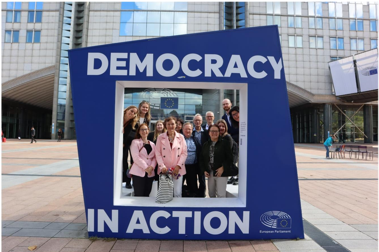
Kuvassa opintovierailun osallistajat Euroopan parlamentin edustalla.