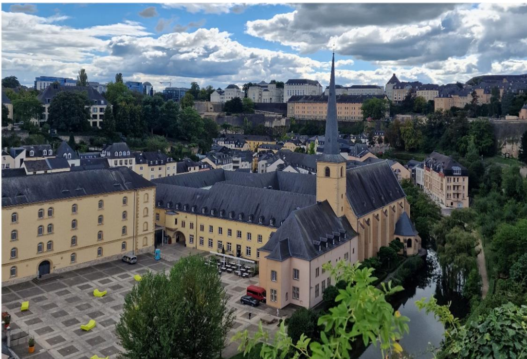
Kuva Luxemburgin historiallisesta keskustasta.