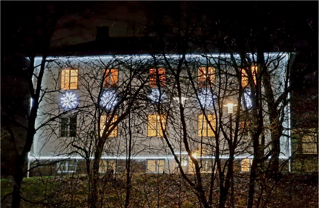
Espoon vanha kunnantalo marraskuussa 2024