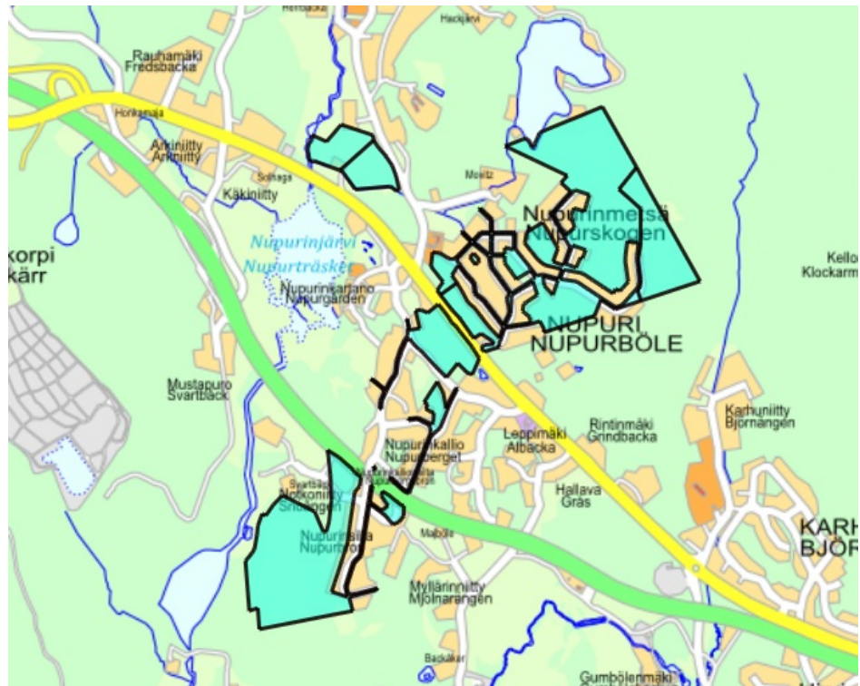
Kuva 1 ostettavat kiinteistöt turkoosilla korostettuina opaskartalla

Kiinteistöjen kokonaispinta-ala on noin 87,4 hehtaaria. Alueella on voimassa Espoon pohjois- ja keskiosien yleiskaava (POKE) sekä Turunväylän eteläpuoleisilta osin Espoon pohjoisosien yleiskaava. Kaupan kohteen olevista alueista noin 28 hehtaaria on yleiskaavan asuntovaltaisilla alueilla merkinnöillä A3 ja AP, noin 29 hehtaaria virkistysalueilla V ja reilu 4 hehtaaria on alueen vanhoja tiepohjia. Turunväylän eteläpuolella sijaitsevista alueista noin 26 hehtaaria on Espoon pohjoisosien yleiskaavan mukaista maa- ja metsätalousaluetta. Kiinteistöjen alue on kokonaisuudessaan asemakaavoittamaton.