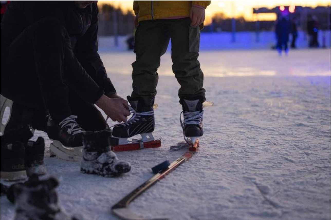
Kuva: Vessi Hämäläinen