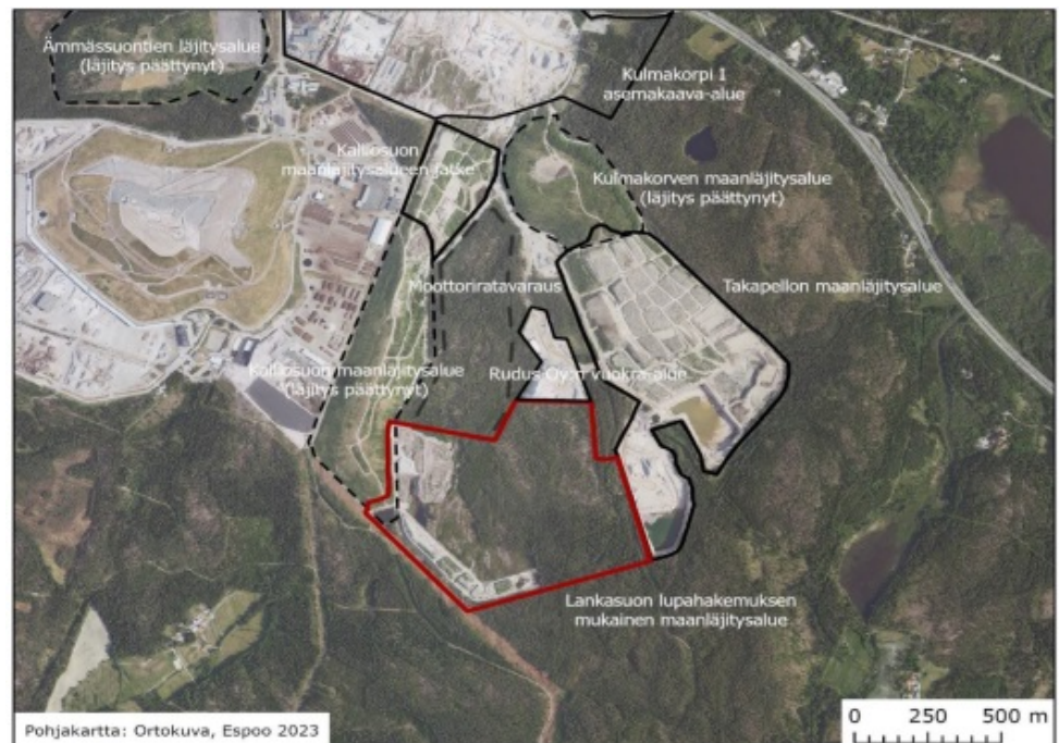
Kuva 1. Lankasuon alue kartassa on rajattu punaisella. Kartassa näkyvät myös muut toiminnot Kulmakorvessa. Ämmässuon jätteenkäsittelykeskus sijaitsee Kulmakorven alueen länsipuolella.

Espoon kaupungin ympäristölautakunta on myöntänyt 26.8.2020 samalle Lankasuon alueelle maa-ainesuon kiviaineksen ottamiselle ja ympäristölupaa kiviaineksen louhinnalle ja murskaukselle. Päätös on saanut lainvoiman 15.3.2024 korkeimman hallinto-oikeuden käsittelyn jälkeen. Lankasuon louhinta ja murskaus on alkanut vuoden 2026 alussa.